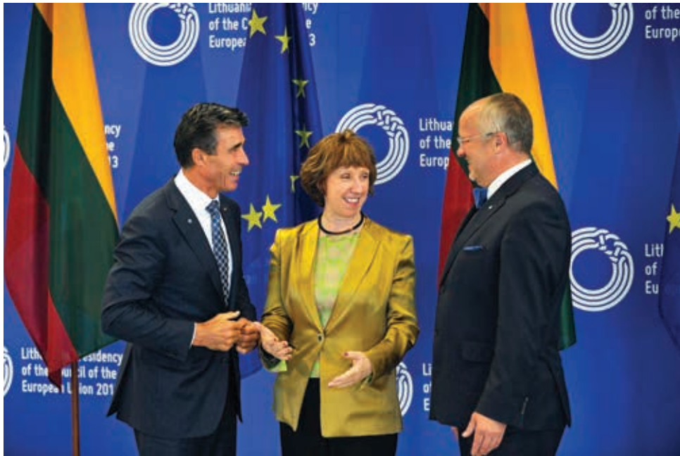
2013 m. rugsėjis. Iš kairės: NATO generalinis sekretorius A. F. Rasmussenas, ES diplomatijos vadovė C. Ashton ir ministras J. Olekas