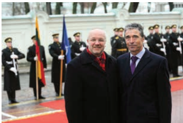
2013 m. vasaris. Ministras J. Olekas ir NATO generalinis sekretorius A. F. Razmussenas

Prieš devynerius metus kovo 29 d. Lietuva tapo stipriausio pasaulyje gynybinio Aljanso nare.