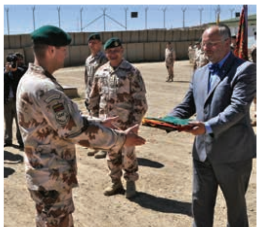
2013 m. Lietuvos vadovaujamos Goro provincijos atkūrimo grupės stovyklos perdavimo ceremonija