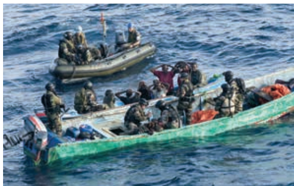
2013 m. operacija AtAlanta prie Somalio krantų