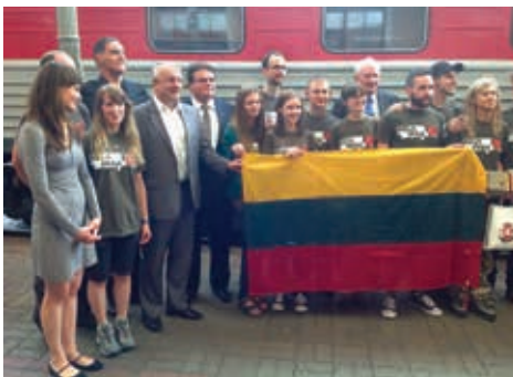
2013 m. liepa. Ministras J. Olekas išlydi „Misija Sibiras 2013“ dalyvius

mokymuose. Itin didelio studentų susidomėjimo sulaukė 2013 m. pradėti organizuoti mokymai pagal karo gydytojo rengimo programą medicinos mokslų studentams: nors buvo planuota pašaukti 20 studentų, gauta daugiau kaip 50 prašymų.