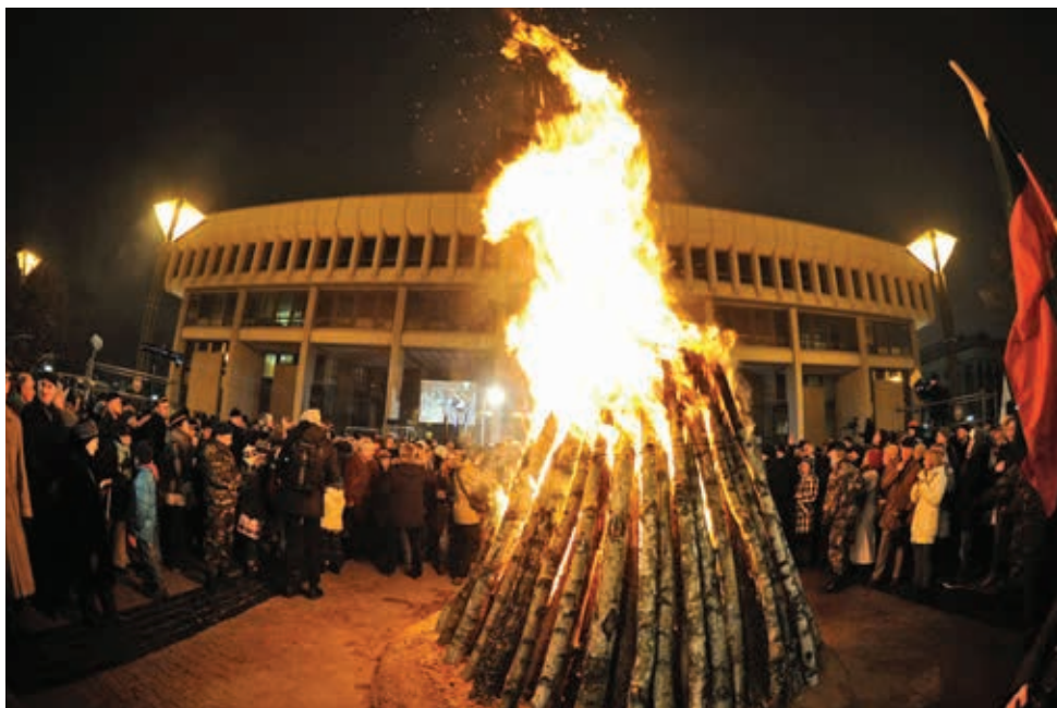
2014 m. sausis. Laisvės gynėjų diena