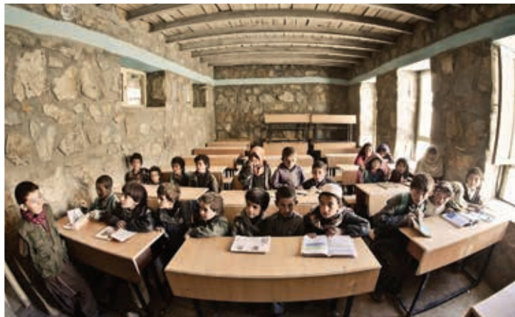
Goro sostinėje Čagčarane buvo statomos naujos mokyklos

Kartą Čagčarano mergaičių mokykloje apsilankė NATO generalinis sekretorius Japas de Hofas Šeferis (Jaap de Hoop Scheffer). Kai jis paklausė, kuo norėtų tapti viena iš vyresnių mergaičių, kai užaugs, ji atsakė – teisėja. Ir pridūrė, kad ne bet kokia, o teisinga visiems teisėja. Šalyje, kur dar visai neseniai daugeliui mergaičių mokslas buvo neprieinamas, tai – stulbinama pažanga.