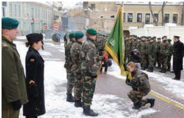
Prisiečia Lietuvos jaunieji šauliai

Rengiant piliečius valstybės gynybai ir formuojant kariuomenės rezervą, sėkmingai tęstas savanoriškas rengimas baziniuose kariniuose mokymuose ir jaunesniųjų karininkų vadų kursuose. 2013 m. į bazinius karinius mokymus (BKM) pašaukti 823 piliečiai. Įvirtinus lengvatas BKM baigusiems asmenims mokytis aukštesiosiose mokyklose ir įsidarbinant, kiekvienais metais didėja norinčiųjų dalyvauti BKM skaičius. 172 aukštųjų mokyklų studentai ir absolventai 2013 m. dalyvavo jaunesniųjų karininkų vadų