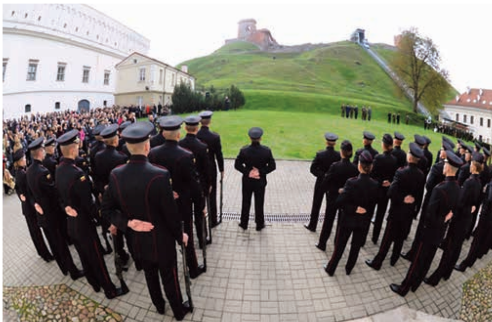
2013 m. rugsėjis. Karo akademijos pirmakursių priesaikos Lietuvos valstybei ceremonija