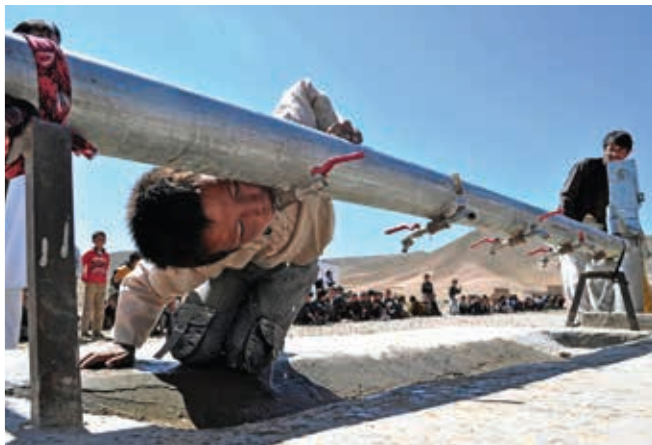
Goro provincijoje įrengta geriamojo vandens tiekimo sistema