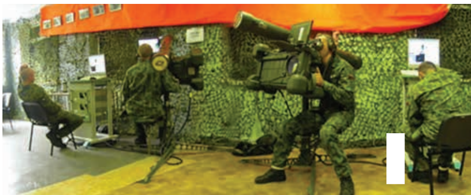
Oro gynybos sistemos RBS-70 treniruoklis

2013 m. taip pat pasirašyta sutartis su gamintoju EUROCOPTER dėl 3 šiuolaikiškų, modernių paieškos ir gelbėjimo sraigtasparnių įsigijimo. Sraigtasparniai bus skirti visai Lietuvai gyvybiškai svarbios valstybinės paieškos ir gelbėjimo funkcijos vykdymui užtikrinti. ■