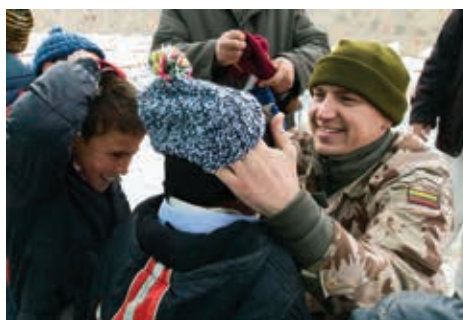
2013 m. Lietuvos kariai Afganistane, Goro provincijoje

NATO vadovaujama Tarptautinių saugumo paramos pajėgų (angl. International Security Assistance Force , NATO ISAF) operacija Afganistane artėja prie pabaigos. Afganistane dar liko mūsų Specialiųjų operacijų pajėgų eskadrono „Aitvaras“ ir Oro pajėgų mokymo grupės karių. Tačiau NATO vadovaujama operacija Afganistano Islamo Respublikoje išliks svarbiausia Aljanso karinė misija 2014 metais. Lietuvos karinė parama bus teikiama šiai operacijai. 2014 m. Lietuva nedidins, bet išlaikys dabartinio karinio indėlio į NATO operaciją Afganistane. Atsižvelgdama į NATO vadovaujamos mokymo misijos „Tvirta parama“ (angl. Resolute Support ) poreikius, 2015 m. Lietuva siūys karinius patarėjus, instruktorius, štabo karininkus į naująją mokymo misiją. ■